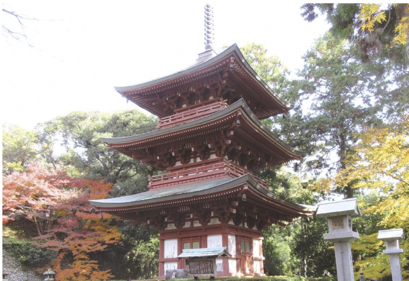
医王山薬王院油山寺 三重塔